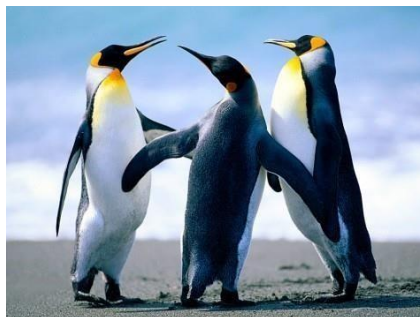
Рисунок 1 – Пингвины

При ссылках в тексте на графическое изображение в ряде случаев указывается вид графического изображения (схема, график, чертеж, фотографии и т.п.). Ссылки могут входить в текст как составная часть или быть заключены в скобки со словом «см.» (смотри) или без него, если ссылка на иллюстрацию сделана первый раз.